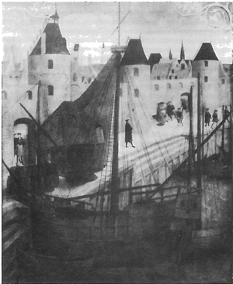
1. de goederenhaven ter hoogte van de Kraanstraat en de Kopingstraat.